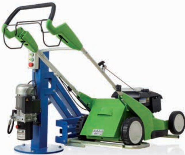
Smart-Säulensystem smart columnsystem