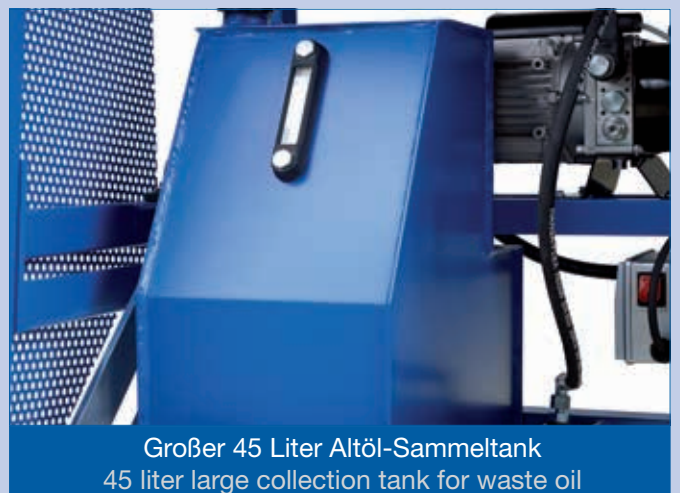
Großer 45 Liter Altöl-Sammeltank 45 liter large collection tank for waste oil