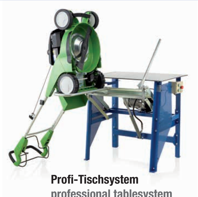
Profi-Tischsystem professional tablesystem