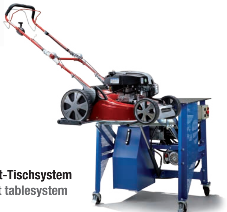
Komfort-Tischsystem comfort tablesystem